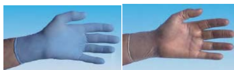
Gants nitrile poudrés

Nous vous proposons une gamme de gants, tous certifiés, qui permettent à la fois une protection et une sécurité d'utilisation tout en assurant dextérité et préhension.