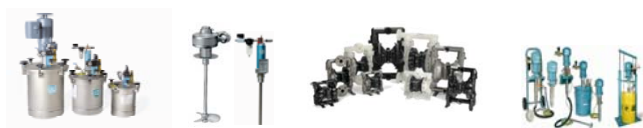
Cuves sous pression